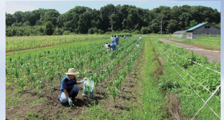
希望学院利用者と連携した農耕作業