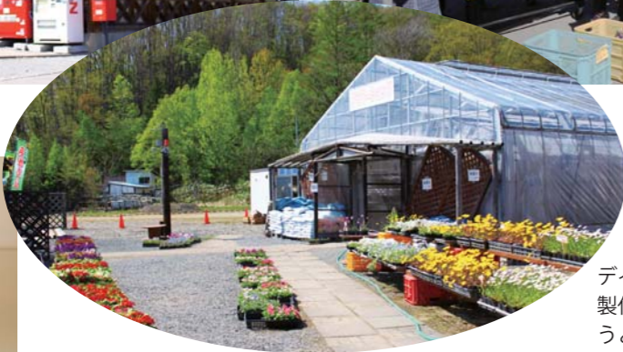
砂川地区各事業所で利用者が作成した農産物やうどん、玉子春にはワーク望や野菜班が育てた花や野菜の苗が並びます