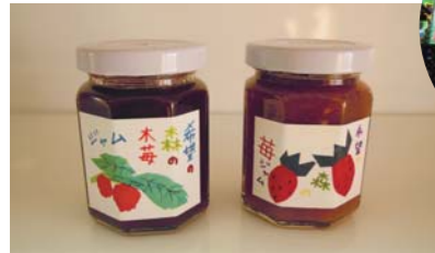
自家栽培の無添加、イチゴ・ホイチゴジャム