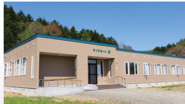
平成24年4月に完成したデイサポート夢の全景

自閉症の方や自閉傾向の強い方の利用希望の受け入れの為に、個室対応できるよう平成24年に総改築した事業所です。