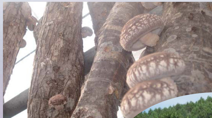
山から切り出した原木での椎茸の栽培