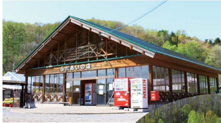
緑の中のふれあいの店

砂川地区各事業所で作られた各種製品の販売をするお店です。お店の隣の花と野菜の苗を販売をするフラワーショップは、春になるとたくさんのお客様が集まってくれます。また秋にはお店も含み、収穫物を販売する収穫祭が開かれます。