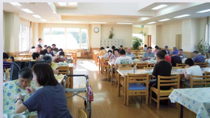
2階食堂での食事風景 2階の食堂は、夜間支援の利用者と通所の 利用者が一緒に昼食をとりま