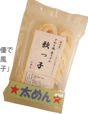
デイサポート優で製作のさぬき風うどん「歌っ子」