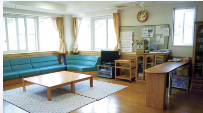
ユニットのデイルーム風景

日中活動支援 (多機能型) 120名 生活介護 100名 就労移行 6名 就労継続B型 14名 夜間支援 定員105名 夜間支援居室等設備 男子棟 4ユニット 44部屋 女子棟 3ユニット 33部屋 ショートステイ居室 7部屋 浴室3 デイルーム7 食堂2 エレベーター1 ショートステイ 7名 日中一時支援