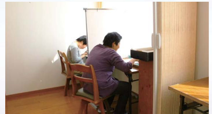
利用者の特徴に配慮して小さく仕切られた居室が11室

デイサポート夢は居宅介護事業を行っています。地域で暮らしている知的障がい者の家事援助、行動援助、移動援助等、時間単位でお手伝いをします。